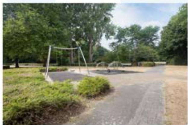
Omgeving van Onderwatershof en Beukenheim