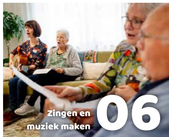
Zingen en muziek maken