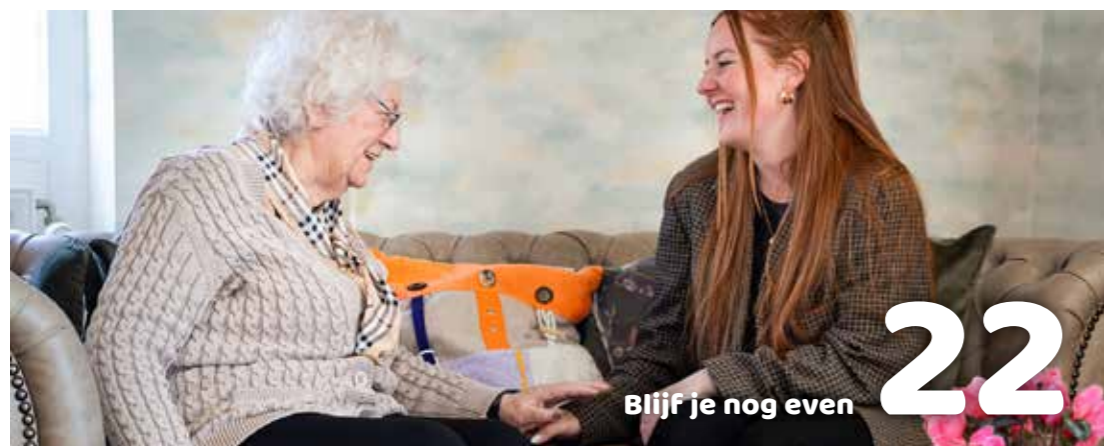
Blijf je nog even